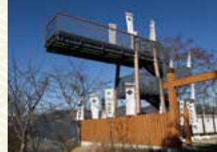
武田信玄の戦国広場 絶景やぐら

標高1,110m地点の崖から 迫り出す一本橋のような展 望台。最高の富士山眺望体 験をお楽しみいただけます。